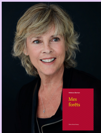
Rencontre poésie - Hélène Dorion