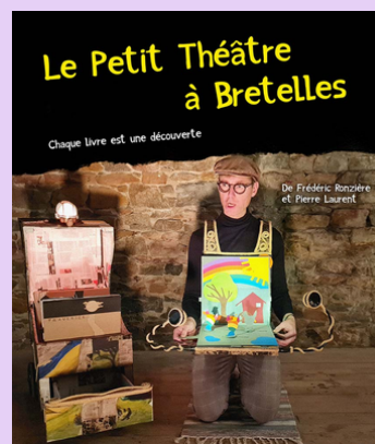
Le petit théâtre à bretelle