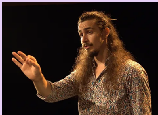
Contes - Histoires d'histoires