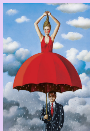
Cirque - Précipitations !

En quête d'inspiration.... Parcours immersif Danse-théâtre